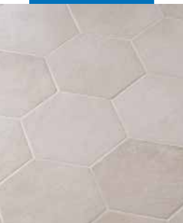
Sol jointoyé avec Keracolor FF