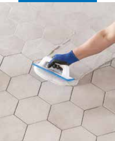
Application de Keracolor FF avec une spatule MAPEI