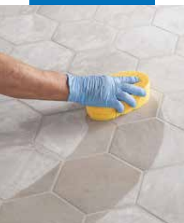
Nettoyage et finition des joints avec une éponge en cellulose dure