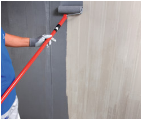
Application d'Eco Prim Grip Plus au rouleau sur du béton

Encore frais, Eco Prim Grip Plus peut être enlevé des sols, des murs et des outils avec de l'eau. Une fois sec, il peut être éliminé à l'alcool.