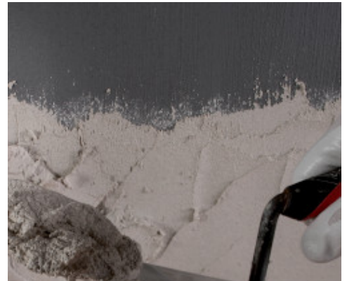
Application d'un enduit sur Eco Prim Grip Plus