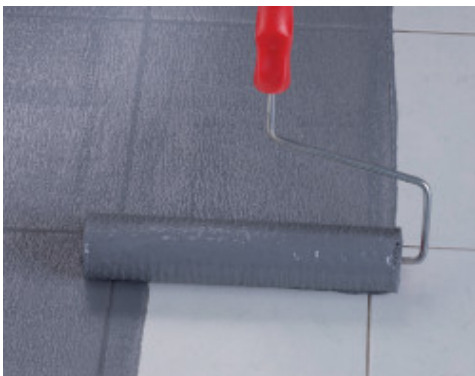
Application d'Eco Prim Grip Plus au rouleau sur un ancien carrelage en porcelaine