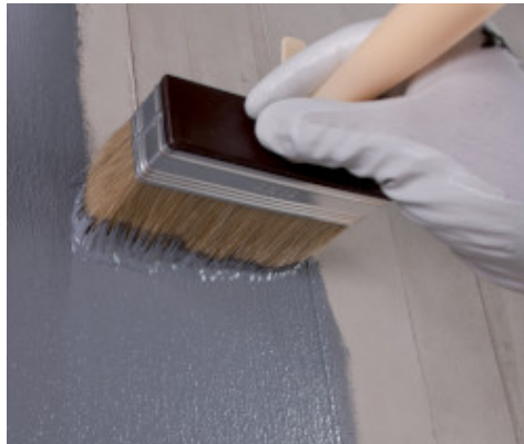
Application d'Eco Prim Grip Plus à la brosse sur du béton